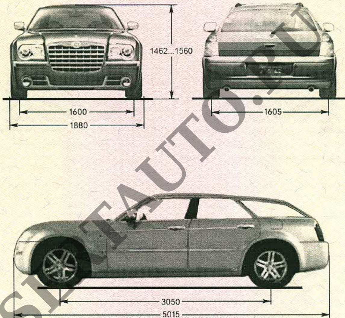
Chrysler 300C (hatchback)