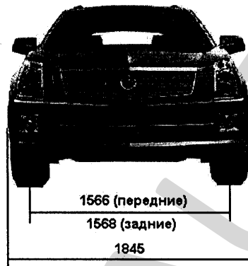
Автомобиль Cadillac GMT 265 (SRX)