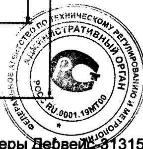
Габаритные размеры Девейл 31315-000010