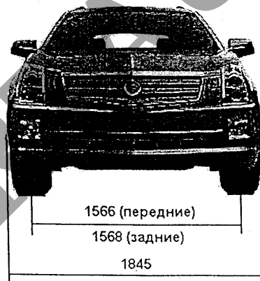
Автомобиль Cadillac GMT 265 (6EB26 SRX)